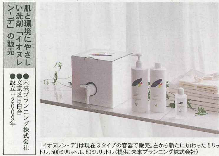
「イオヌレン-デ」は現在3タイプの容器で販売。左から新たに加わった5リットル、500ミリリットル、80ミリリットル

肌と環境にやさしい洗剤「イオヌレン-デ」の販売 ●未来プランニング株式会社 ●文京区目白台 ●設立2009年